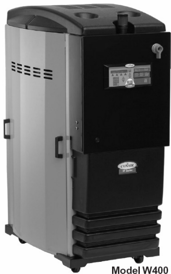
Model W400 Mit DC2 Steuerung und Alarmpaket